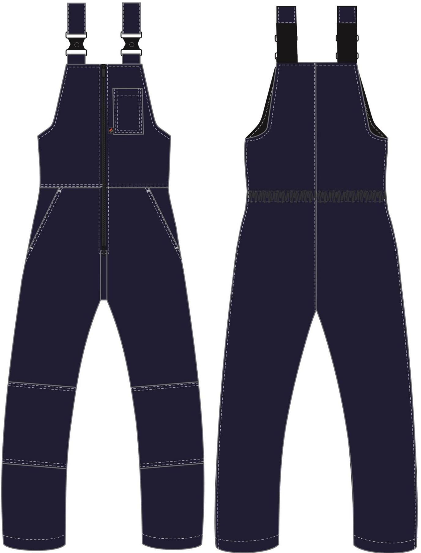
Рис. 2. Эскиз Полукомбинезон зимний Фаворит (тк.Смесовая,240), т.синий вид спереди и сзади.